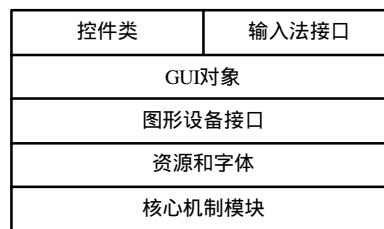
图2 核心图形操作层结构图